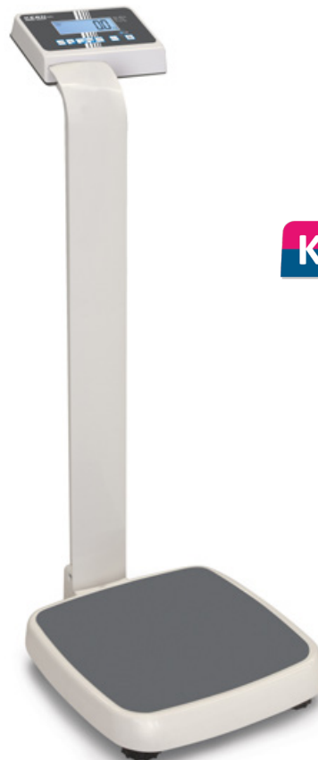
KERN MPE-P mit Stativ