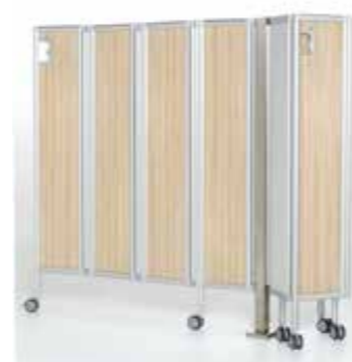
Edelstahlsäule max. mit 4 Faltwänden bestückbar