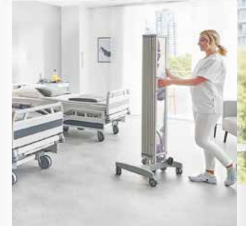
Einfach fahren von Einsatzort zu Einsatzort