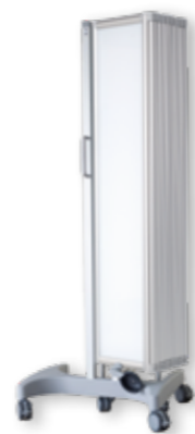
Formschön und stabil