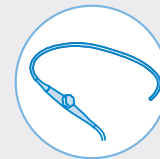
Transösophageale Ultraschallsonden (TEE)