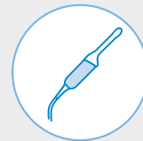
Transvaginale Ultraschallsonden (TVUS)