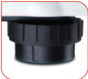
Groe Nivellierfue an der Unterseite der Wiegebasis fur sicheres Aufstellen.