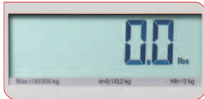
Groes Display fur leichtes Ablesen.