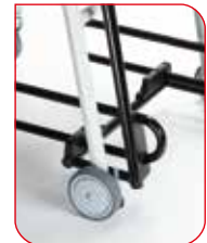
Um das Hinsetzen und Aufstehen zu erleichtern, sind die Arm- und Fußstützen hochklappbar.