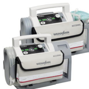
ACCUVAC Lite mit Einwegbehältersystem und Zubehörtasche, WM 11745