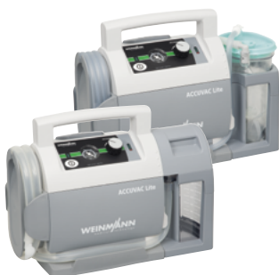
ACCUVAC Lite mit Einwegbehältersystem, WM 11705

Wählen Sie Ihre Wunschkombination der ACCUVAC Lite – abgestimmt auf Ihre Bedürfnisse: